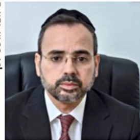
השר בוסו. "בשורה גדולה"