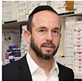
ליברמן, "שמחים מאוד"