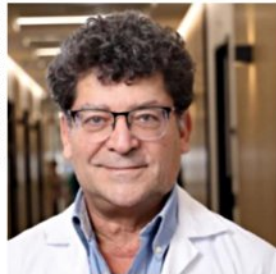
פרופ' אורביטו. "עומס כלכלי"